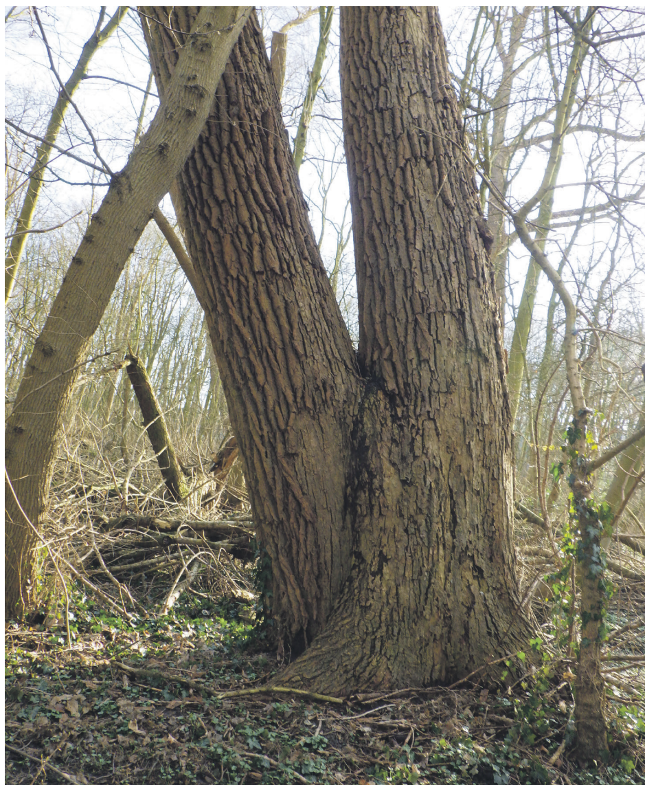
benen uit de grond